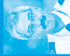
Franz Lutz Polizeipräsident

„Polizeipräsenz in Stuttgart? „Gerne! Schon mal über Ihre Präsenz“ im Förderverein nachgedacht?“